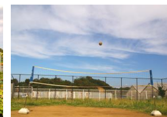
裏庭、バレーボール