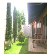
テラス、喫煙スペース