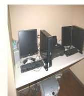
パソコン、プリンター